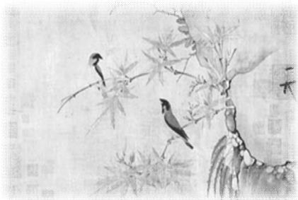
宋 赵佶 竹禽图

这曾是一个人们眼里不可能完成的任务——给分散在全球200多个收藏机构的1500多张中国宋代绘画制作一套“全家福”。